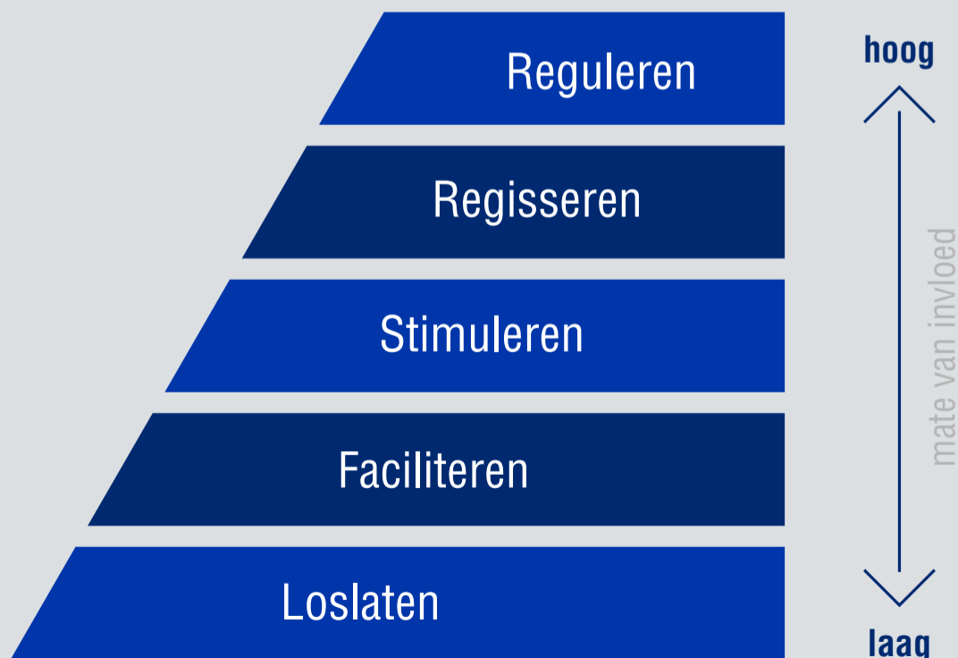
Figuur boven Rollen en mate van invloed (bekeken vanuit de gemeente)

We gaan voor plannen met draagvlak. Bij initiatieven vanuit de samenleving toetsen we of er een zorgvuldig proces gevolgd is en of er draagvlak is. Daar waar wij het initiatief nemen, zorgen we voor een zorgvuldig proces en creëren we zoveel mogelijk draagvlak.