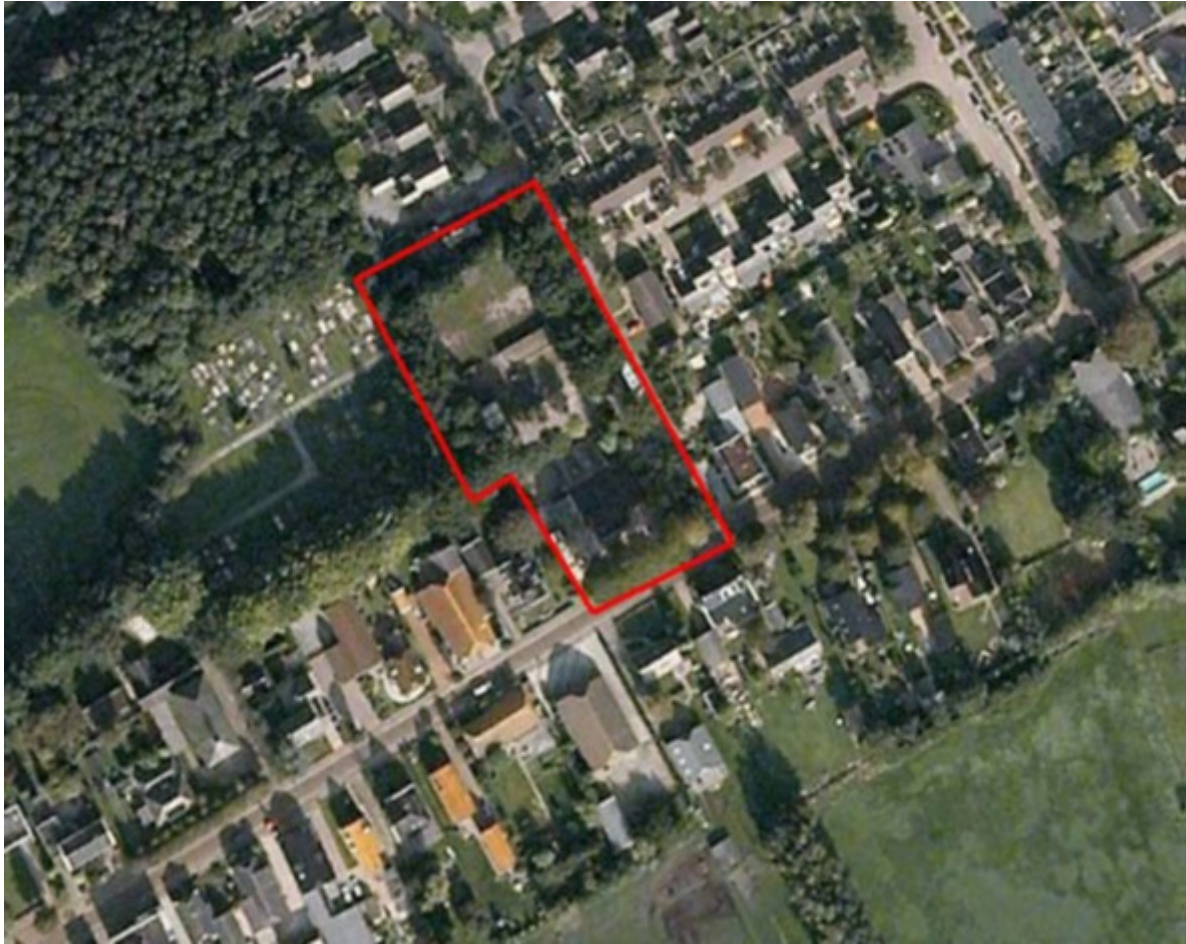
Globale begrenzing inbreidingslocatie

Als programma worden er in totaal 6 woningen gebouwd, waarvan 4 halfvrijstaande woningen koop en 2 vrije sector koopwoningen. De woningen kunnen worden gerealiseerd in particulier opdrachtgeverschap of in projectmatige vorm.