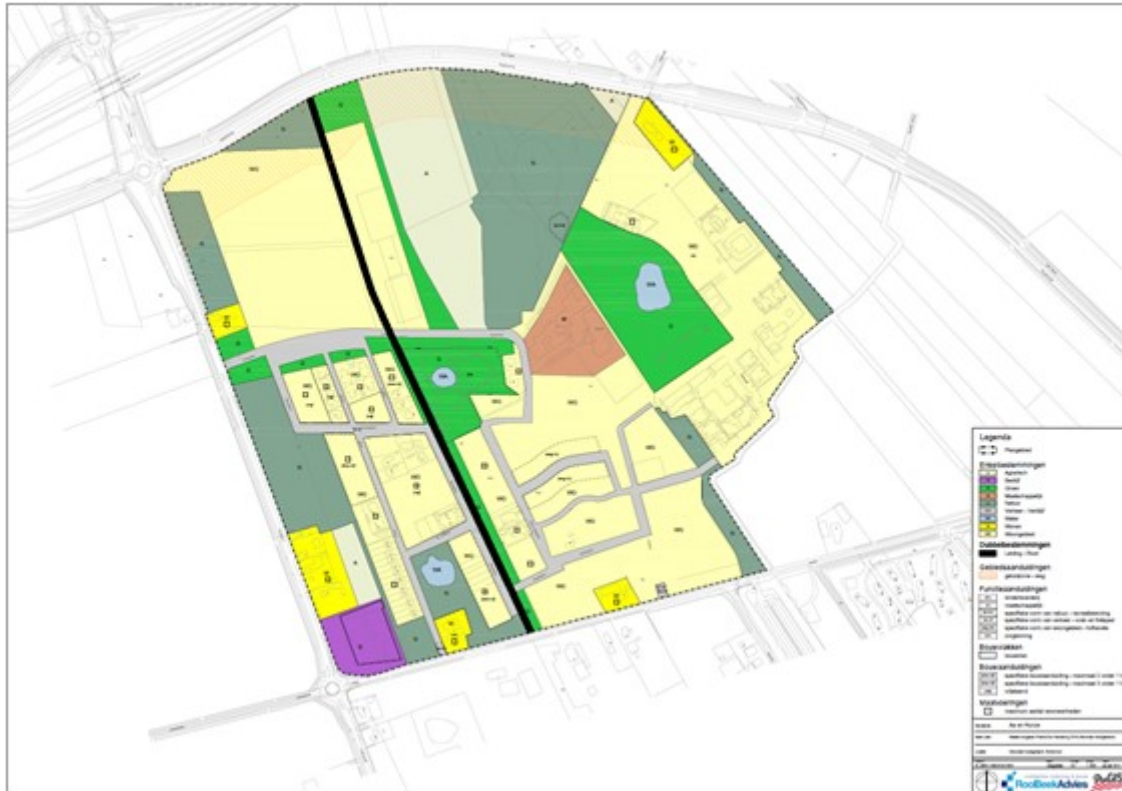
Kaart Bestemmingsplan 2016

Op basis van het geldende bestemmingsplan heeft Copijn Tuin- en Landschapsarchitecten de oorspronkelijke stedenbouwkundige visie herijkt en heeft een tweede herijking in 2014 plaatsgevonden.