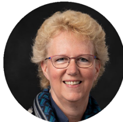
Wethouder K. ten Brink PvdA